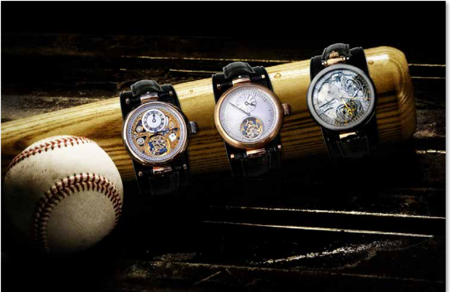
Uli Glasers eigene Uhrenmarke "JTP unique"